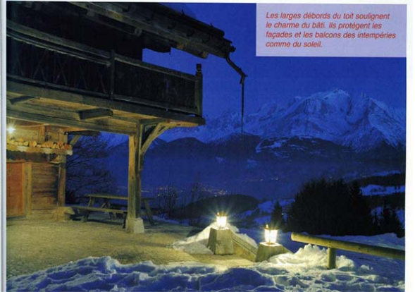
Les larges débords du toit soulignent le charme du bâti. Ils protègent les façades et les balcons des intempéries comme du soleil.