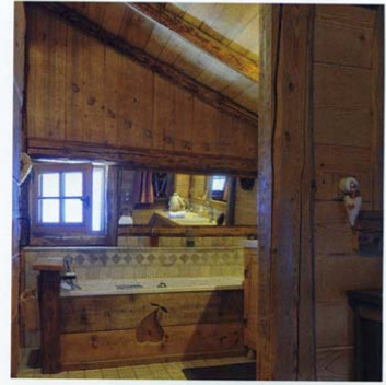
Les interrupteurs sont en porcelaine comme autrefois.

Tout a été pensé dans les moindres détails. A l'instar de l'ensemble du bâti, l'escalier de l'étage, les palines (balustrades en bois travaillé) et la main courante ont été réalisés en vieux bois. Cette architecture patrimoniale aux grands volumes est souvent énérgivore, aussi la pose de doubles vitrages s'imposait comme une évidence. Pour ne pas affecter le vocabulaire de façade la totalité des huisseries a été conçue sur mesure. « Quand j'ai fait les travaux, on ne parlait pas de réchauffement climatique et peu du prix de l'énergie. Si c'était à refaire je renforcerais l'isolation. La chaudière fioul permet aux occupants qui louent d'être autonomes, sinon j'aurais choisi le bois »