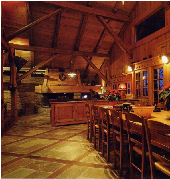
L'entrée dans le mazot s'opère par le salon. Il fait le bonheur des enfants et des amoureux qui y voient un refuge.